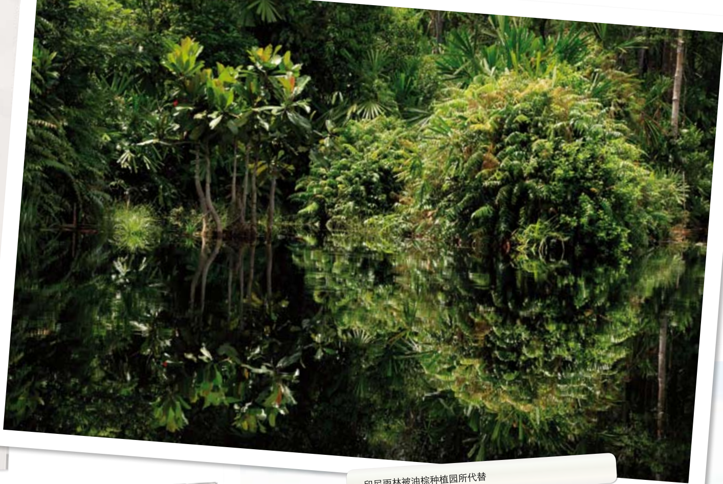
印尼雨林被油棕种植园所代替