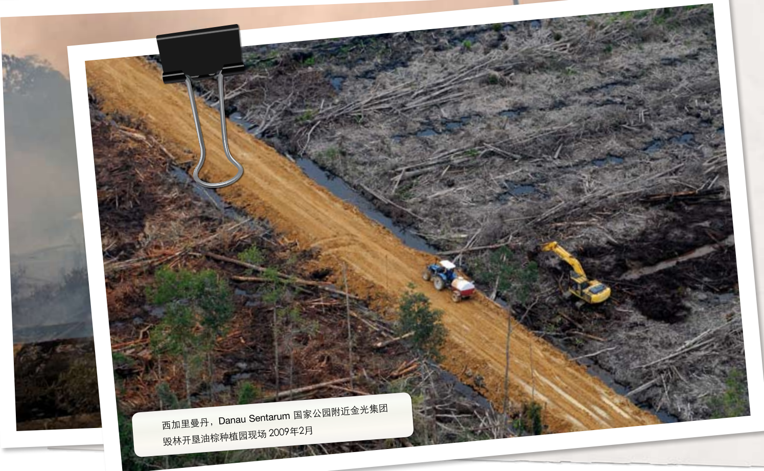
西加里曼丹，Danau Sentarum 国家公园附近金光集团 毁林开垦油棕种植园现场 2009年2月