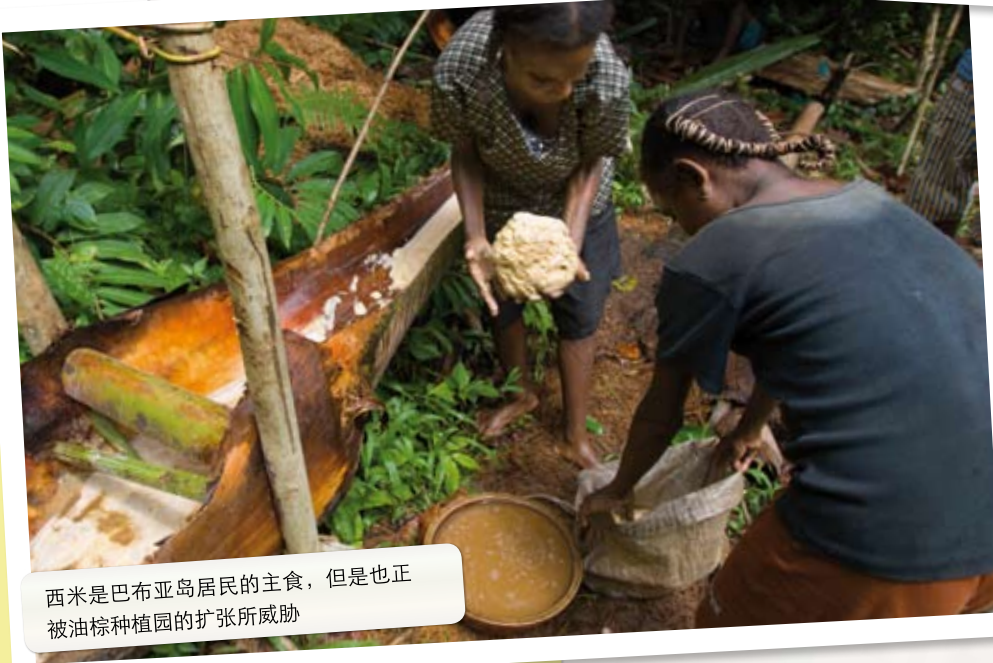
西米是巴布亚岛居民的主食，但是也正被油棕种植园的扩张所威胁

金光集团向苏门答腊BUKIT TIGAPULUH地区的扩张对当地的两个少数民族部落TALANG MAMAK和ORANG RIMBA 47 来说同样是灭顶之灾。对于这些依靠森林里的资源和河流生活的人们来说，砍伐原始森林代之以种植园无疑威胁着他们的未来。