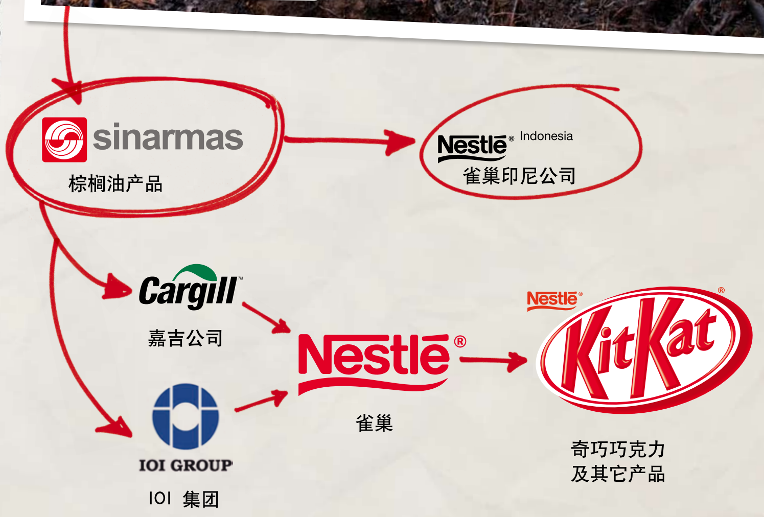
图表1：雀巢和金光集团的贸易链