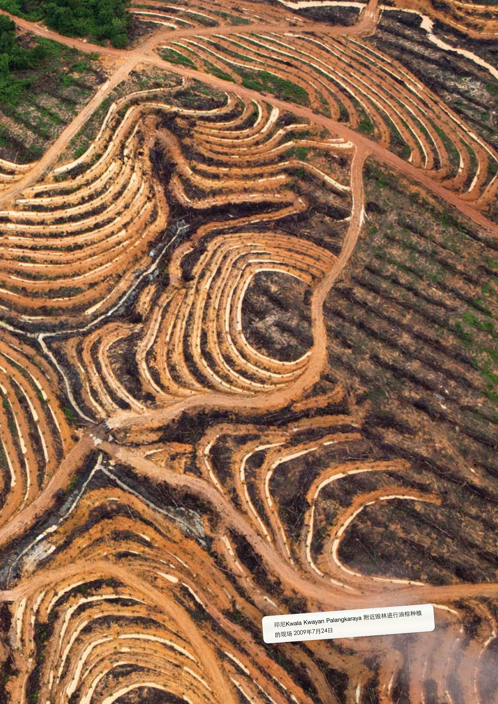
印尼Kwala Kwayan Palangkaraya 附近毁林进行油棕种植的现场 2009年7月24日