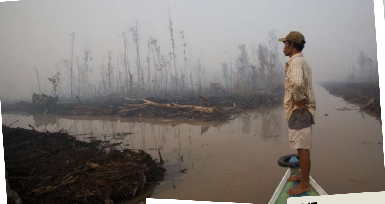
油棕种植企业往往挖掘出这样的沟渠，排干泥炭地并焚烧雨林