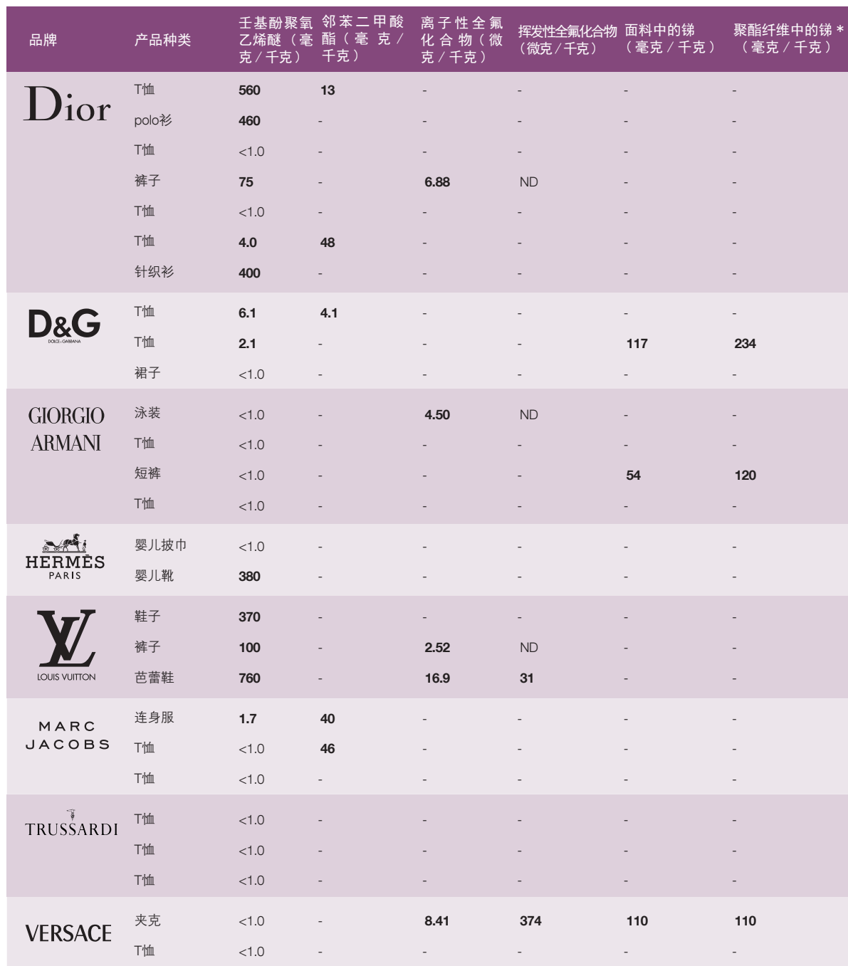
表 1: 检测出有毒有害物质的样品数与检测结果 6