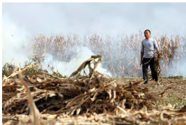
2008年10月11日，山东省平邑县卞桥镇卞桥村村民在焚烧秸秆