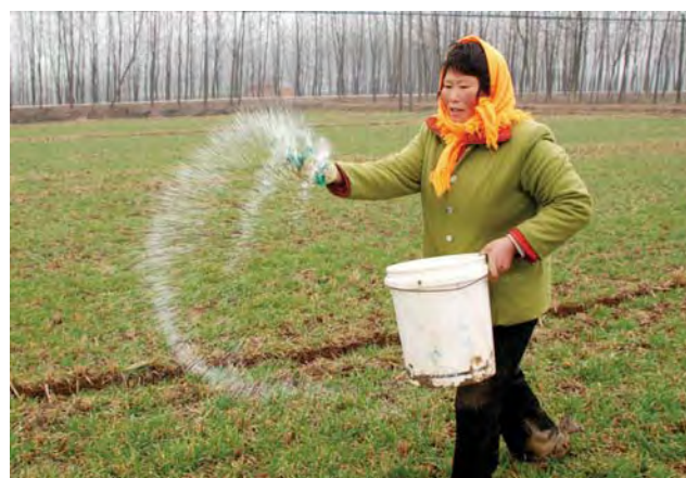
江苏的农民在田间施肥