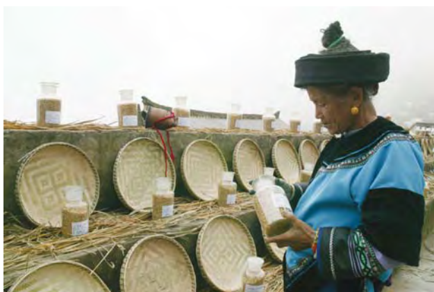
丰富多样的老品种稻种给农民提供更多的选择

丰富的生物多样性是传统农业体系的一个显著特点，特别是在多样性种植以及/或农林混作模式下的植物生物多样性。