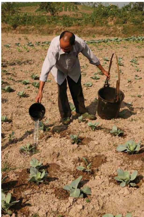
2007年10月5日上午，四川省广安市华蓥山区永兴镇的农民在挑水浇灌干枯的菜苗。截止当日，永兴镇已有32天滴雨未下。© CFP

在发展中国家，小农户的收入通常低于当地的人均收入，他们是最贫困也最容易受到气候影响的人群。在多雨地区，以及地下水源已经被过度抽取的灌溉区，大多数气候变化都会给小农户带来大灾难。