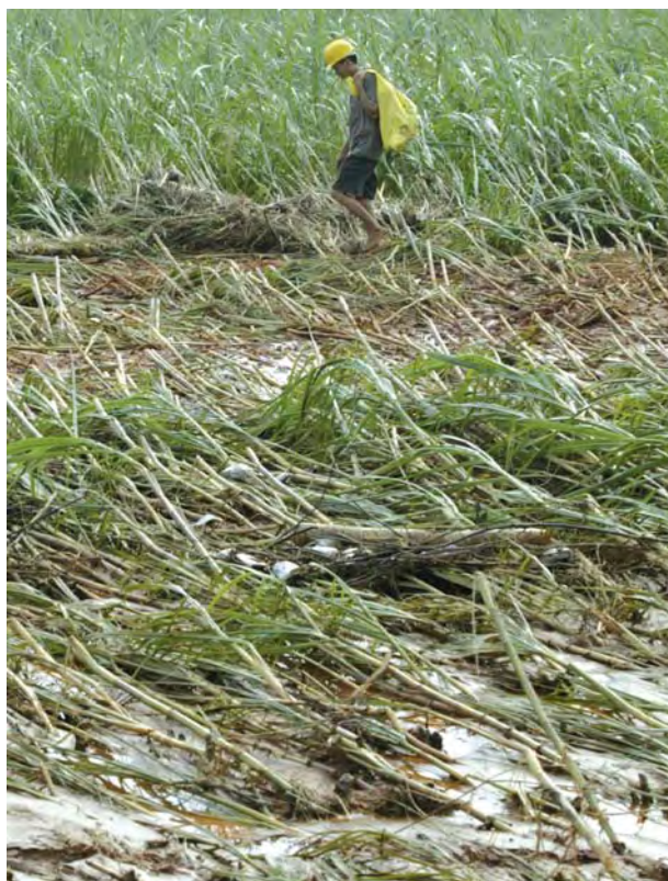
2007年8月14日，广东省雷州市北和镇下海仔村，被淹后的甘蔗田里布满死鱼。受台风“帕布”影响，广东雷州市遭遇两百年一遇的暴雨袭击，北和、龙门等镇受灾严重。

武艳娟，李玉娥，2009. 气候变化对生计影响的研究进展. 中国农业气象. 30 (1) :8-13