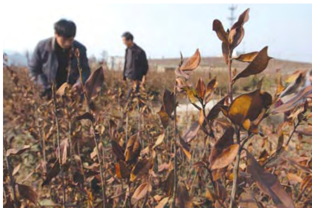
2008年3月，余姚市大岚镇遭受严重冻害的茶叶

未来粮食安全问题不仅取决于未来的粮食单产水平，还取决于粮食播种面积、技术贡献程度、人口总量、国际贸易情况等。目前还很少有考虑到气候变化影响后的粮食安全问题的综合研究结果，更缺乏考虑到气候变化适应措施后的粮食安全评估。